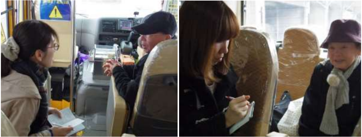
写真1 男性利用者へのインタビュー 写真2 女性利用者へのインタビュー