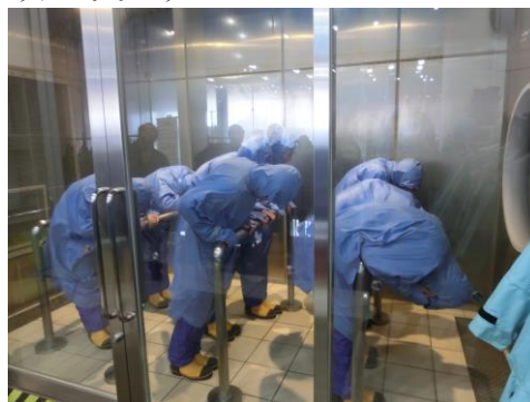
暴風雨体験 (四季防災館)