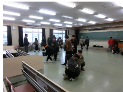
トレーニング 倒れている人をどう救うか