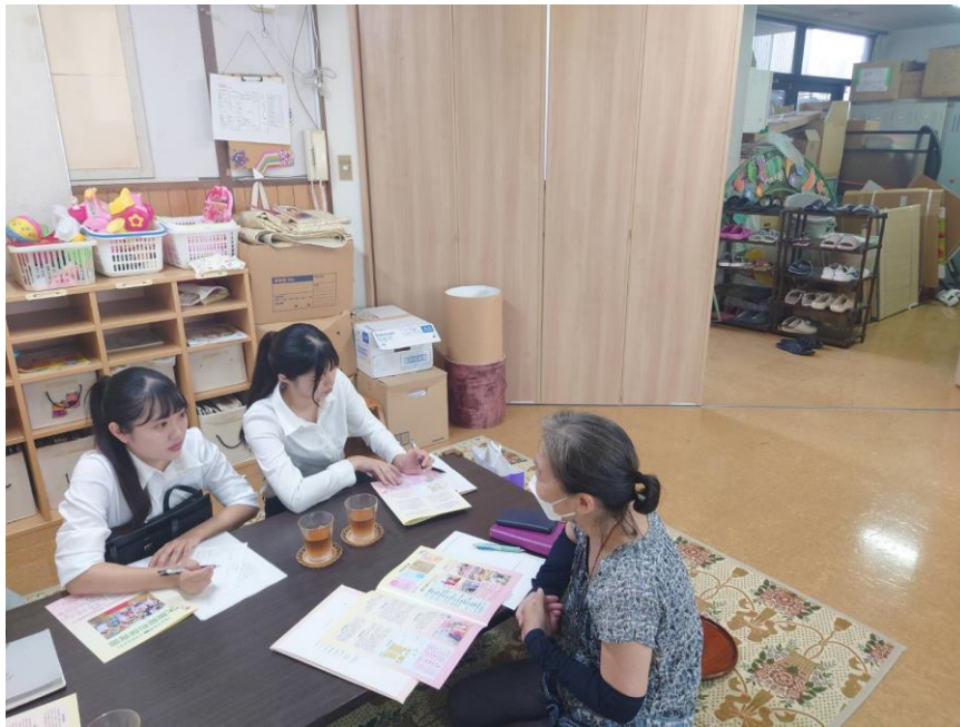
④大阪府大阪市の保育施設を見学している様子